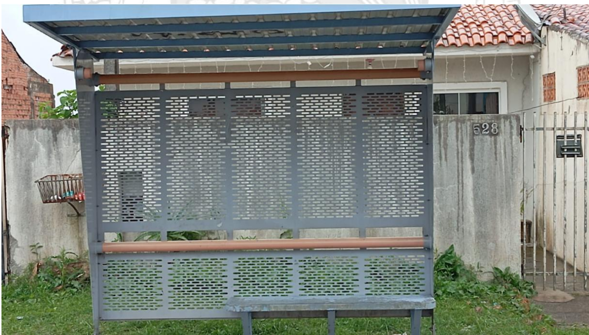
1.2 Ponto de ônibus Rua Prímula, nº 528.