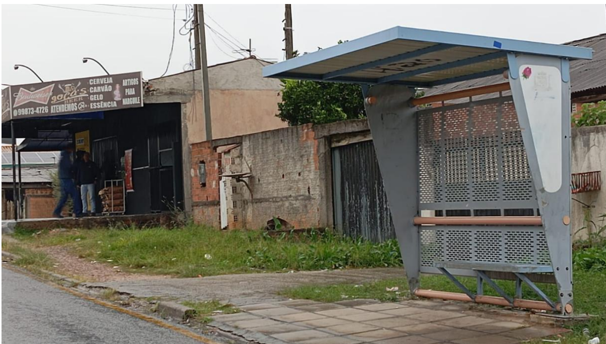
1.1 Ponto de ônibus Rua Prímula, nº 528.

Edifício Vereador Pedro Nolasco Pizzatto