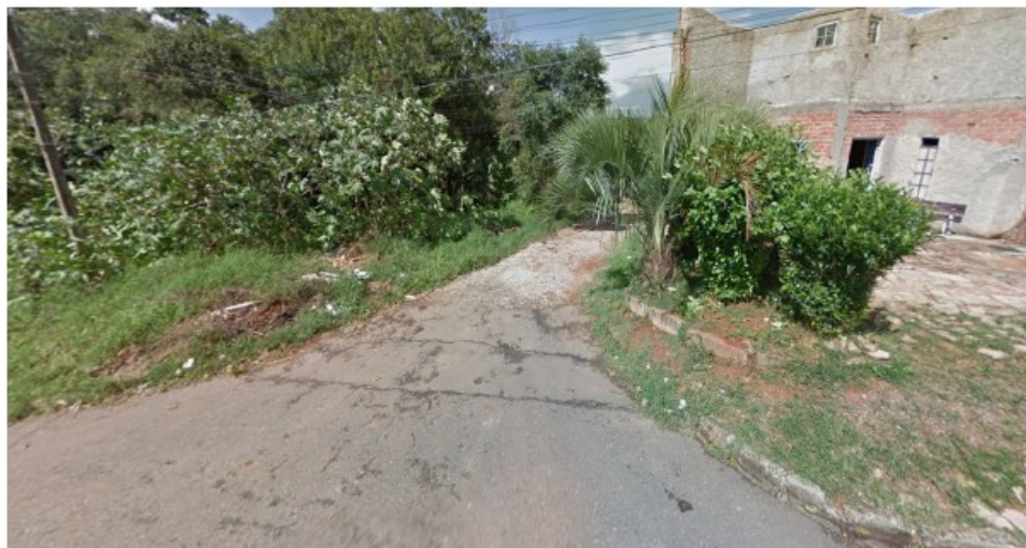
R. das Dálias com Travessa das Dálias, Jardim D'Ampezzo.

Câmara Municipal de Araucária, 31 de janeiro de 2022.