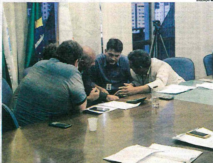
Hissam com alguns de seus secretários definindo valor do reajuste do auxílio-alimentação

Na oportunidade, os representantes da Prefeitura pontuaram que não era possível, em hipótese alguma, a concessão do reajuste salarial proposto pelos sindicatos. Argumentaram ainda que estão sendo feitas várias contratações