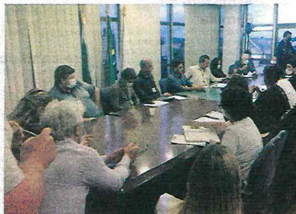
Reunião aconteceu no salão nobre da Prefeitura